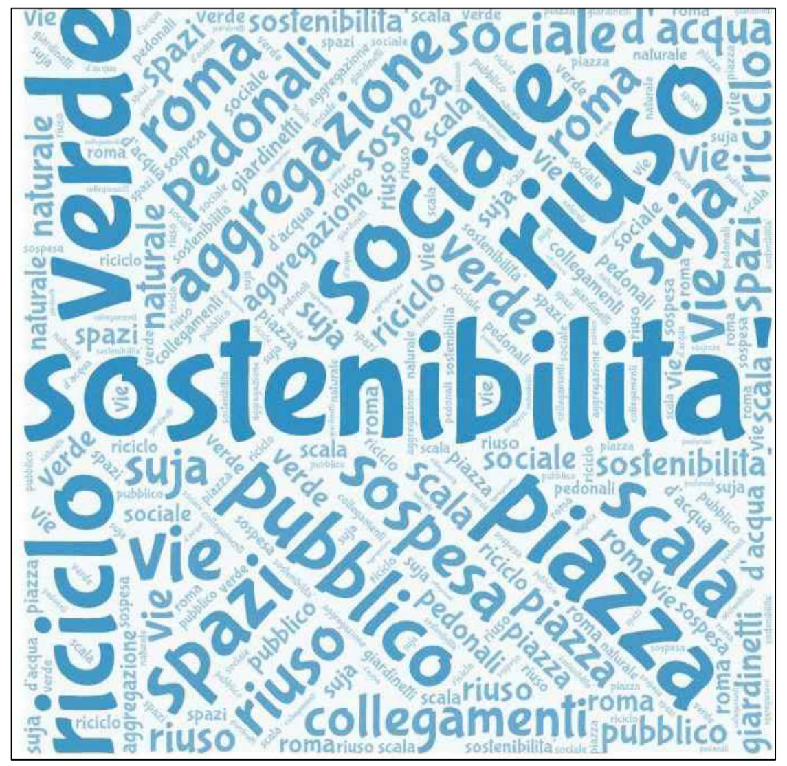
LE PAROLE DEL PROGETTO